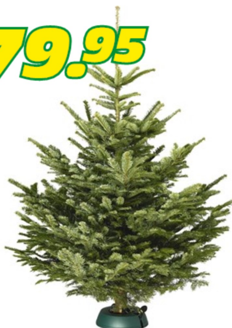
Nordmanntanne 200- 230cm