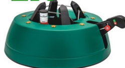
Christbaumständer Star-Max Start 1