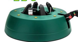
Christbaumständer Star-Max Start 3