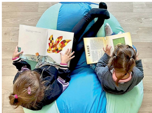
La biblioteca è stata inaugurata nel centro Santa Maria Nascente di via Capecelatro con una giornata di festa